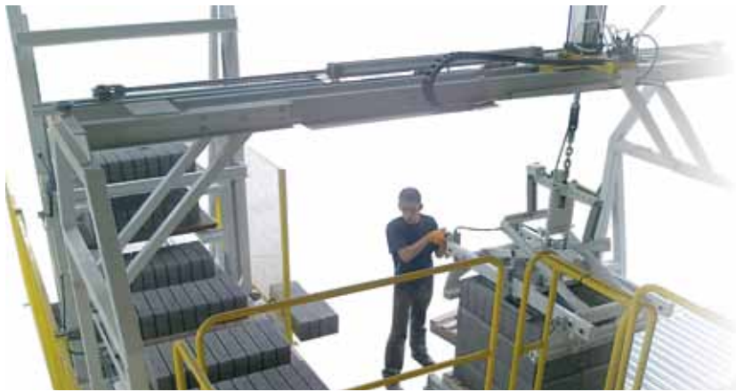
Détail de pince pneumatique pour palettiseur manuel.